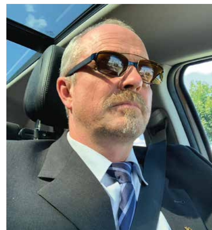
Ein stilvolles Auftreten ist selbstverständlich.

Planen Sie oder ein Verein, in dem Sie engagiert sind, einen Grossanlass? Luc bietet durch seinen Sicherheitservice einen reibungslosen Ablauf, von der Zutrittskontrolle und der Sicherheit der Besucherinnen und Besucher bis hin zur Absicherung von Bühnen und Parkdienst.