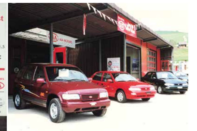
Werbung zur Ausstellung 1995.