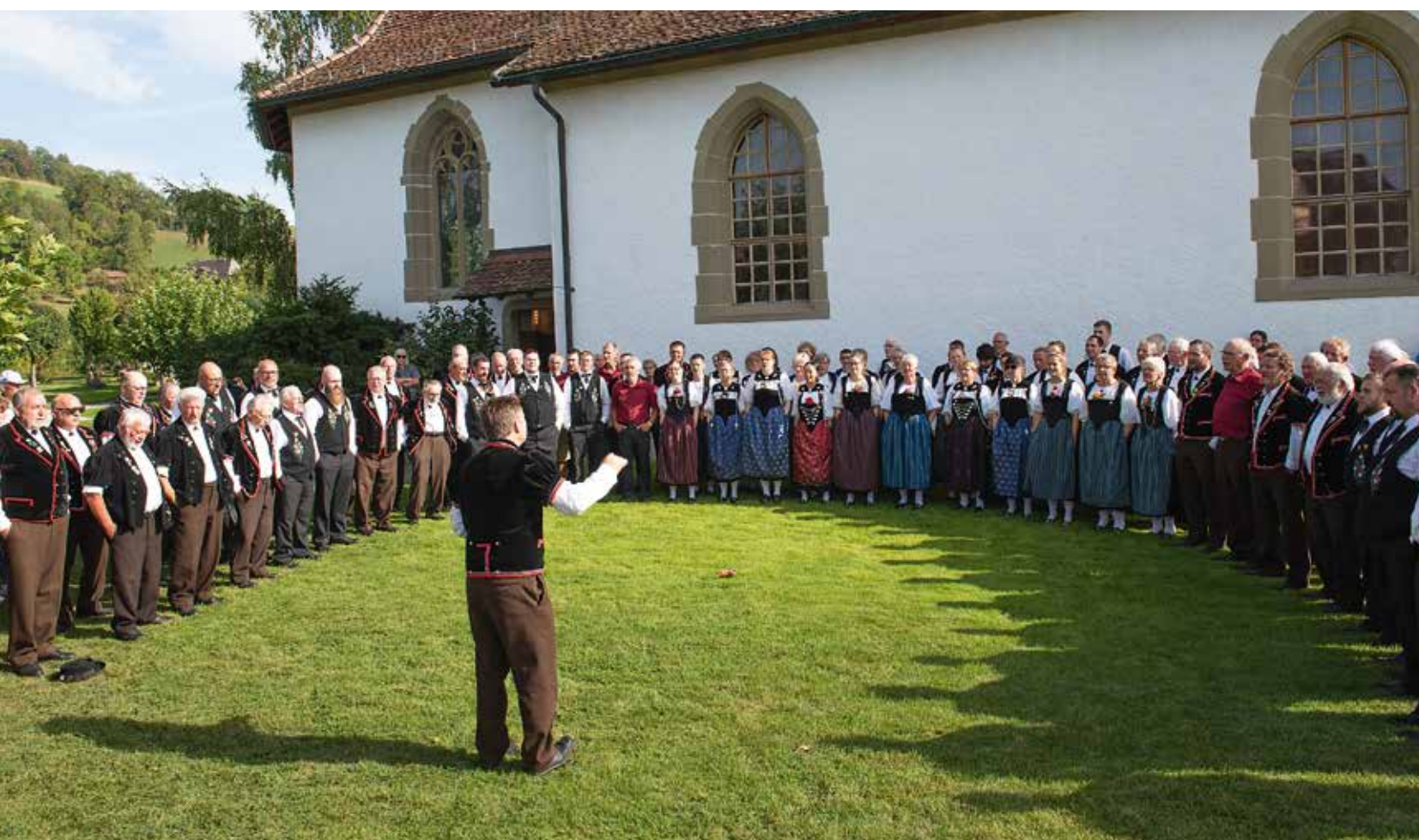
Worbentalisches Jodlertreffen, September 2023.