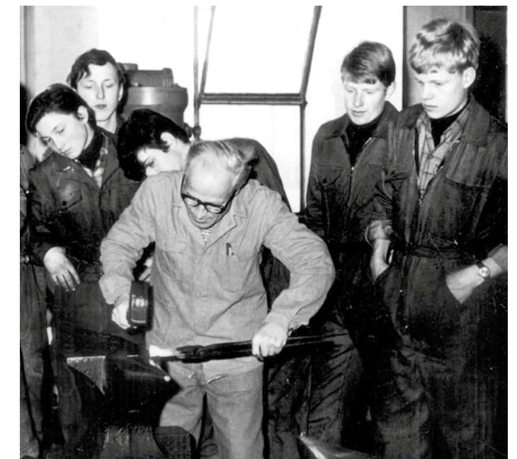
Lehre als Landmaschinenmechaniker.