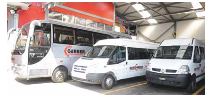
Beginn mit Schul- und Reisebussen, 2010.

Und dann wäre da noch der Busbetrieb. «2009 übernahmen wir auch den Schulbusbetrieb für die Gemeinde Vechi-