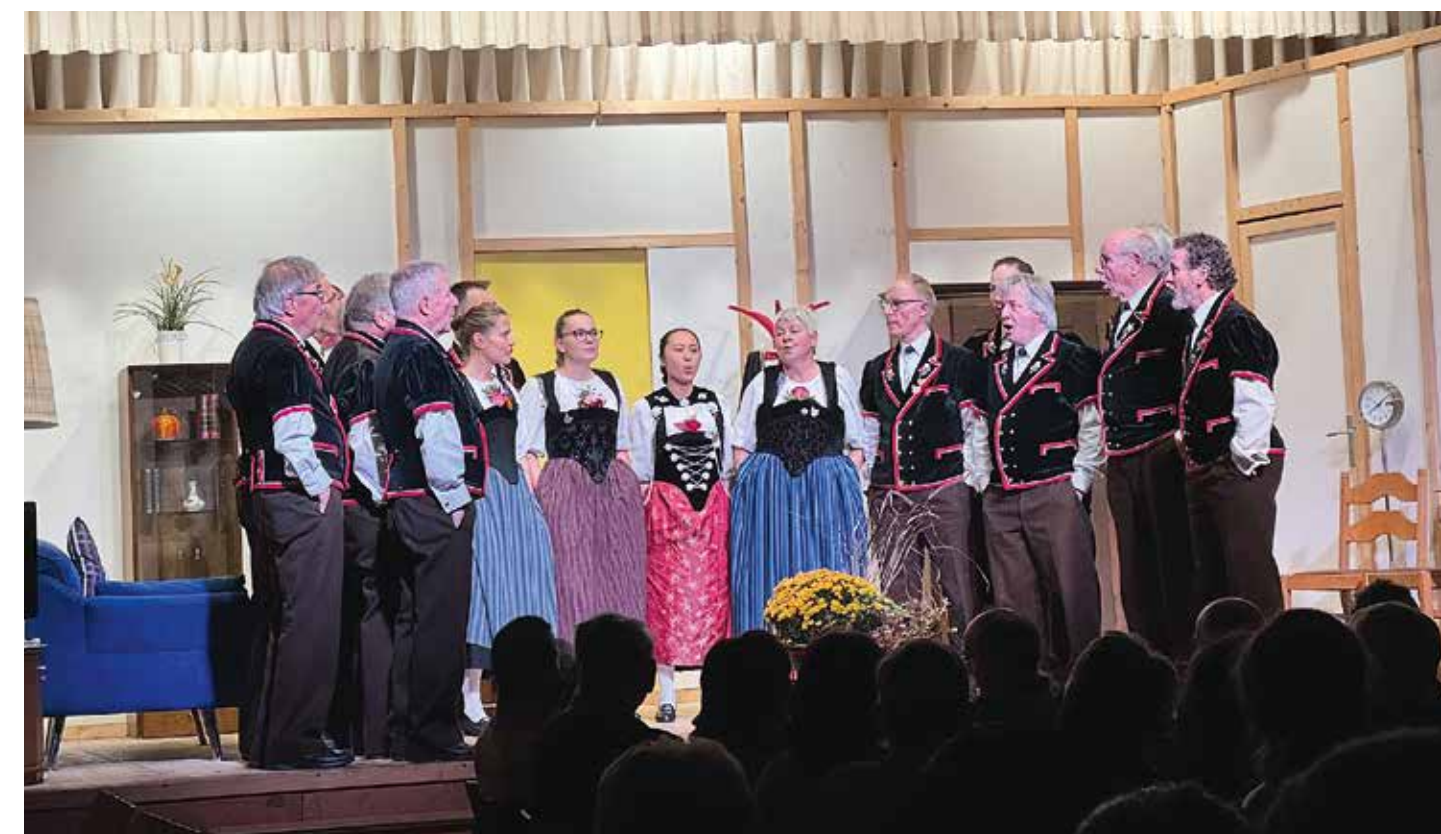
Unterhaltungsabend, Konzert und Theater 2023.