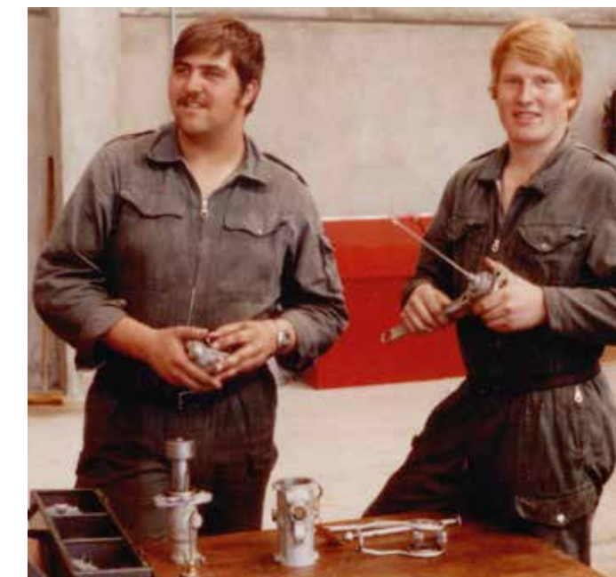
Ausbildung zum Motmech in der Armee.