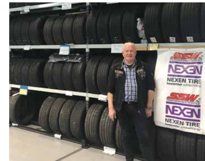
Gerbers Pneuhotel 2023.