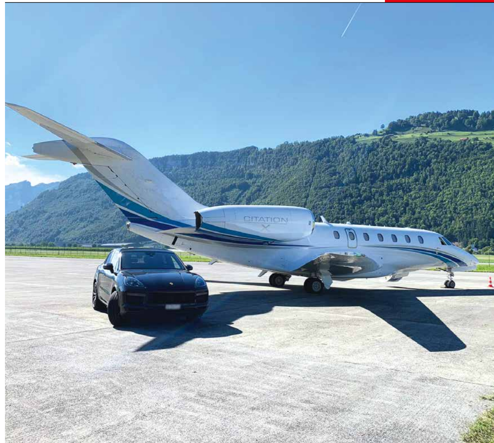
Chauffeurdienste und Autoüberführungen gehören zu den Dienstleistungen von WD Security & Facility GmbH.