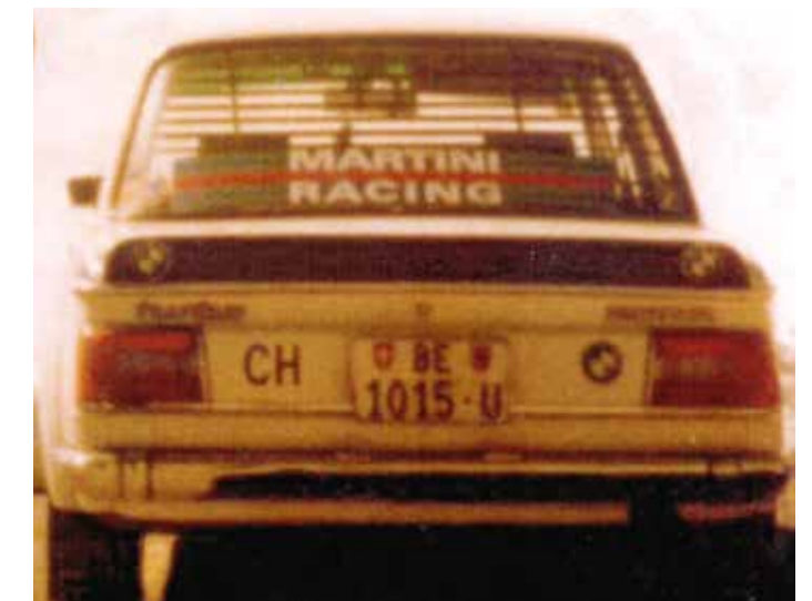
Kurts BMW mit erster Garakennummer im Jahr 1977.